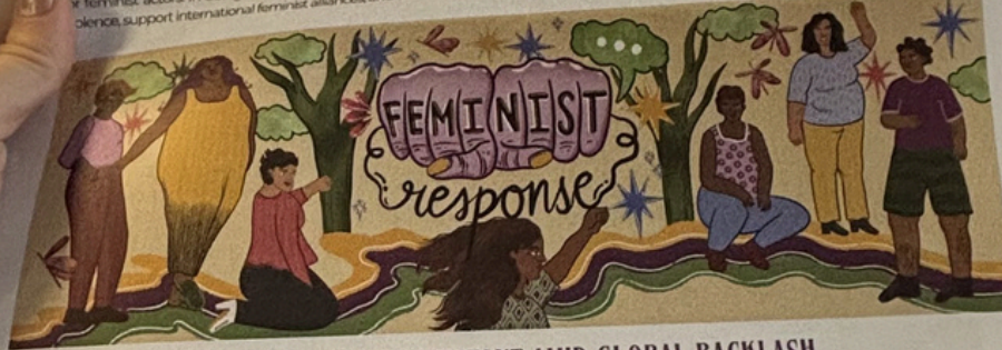
Illustration by Soraksha Jeyaraj

Hello! We are The Global Unit for Feminism and Gender Democracy and we are implementing the international gender policy programme of the Heinrich Böll Foundation. The anti-feminist rollback is gaining global momentum. Authoritarian and right-wing governments are working closely with the anti-gender movement, which has been growing stronger for years, to attack hard-won rights of women, queer people, refugees, and other vulnerable groups. We analyze gender and power relations and expand the scope for action for feminist actors. In doing so, we stand up for reproductive justice, strengthen intersectional approaches to combating gender-based violence, support international feminist alliances, and call for a feminist organizational and leadership culture.